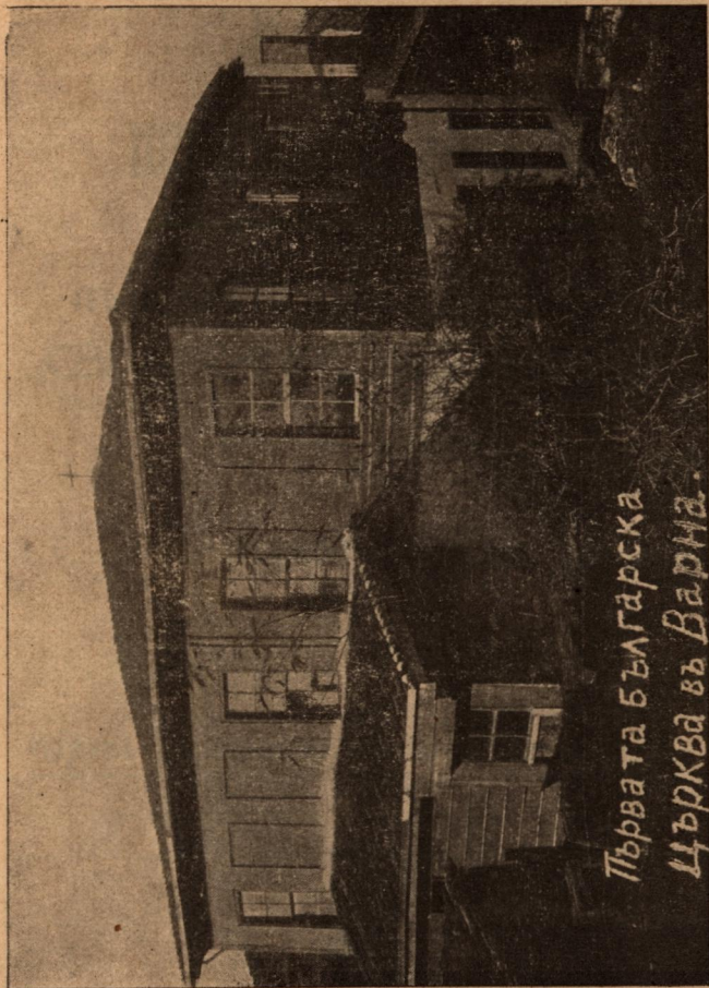
Първата Българска Църква във Варна.