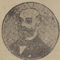
Л. Л. Заменхов

Усжвжршенствованията на средствата за сжбщения в 20-ия век — железниците, параходите, телеграфите — и колосалното развитие на размяната са свжрзали току-речи всички страни и народи на земята в едно цяло, и затова нуждата от един общ език, лесен, достжпен за всички и сжвжршен в езиковно отношение, се явява днес наложително. Още в старо време хората са чувствували тая нужда. В народната библейска легенда за вавилонското стжлпотворение, напр., се изразява ясно пакостта на разноезичието, на което се е гледало като на Божие наказание. Ала най-ярко се изтжква тая нужда в сжвремения, 20-ия век — века на силно развитите се международни сношения. И за щастие на всички хора, език, който да отговаря на всички изисквания на един сжвжршен международен език, леснота в изучването, благовучие, способност за изразяване най-разнообразни нюанси на мисжлта и чувството, е вече сжздаден. Това е есперанто , езика на руския лекар Л. Л. Заменхов. В 1887 г. излезе неговия пржв учебник по есперанто. От тогава до днес числото на есперантистите постоянно е расло, и днес милиони говорят и си служат с ес-