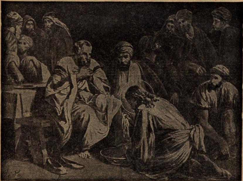
Исусъ мие нозетѣ на апостолигѣ.

Умиване нозетѣ. Два дни преди Пасхата Исусъ билъ въ Витания. Оттукъ пратилъ Петра и Иоана въ Иерусалимъ, като имъ казалъ: „Идете въ града, и тамъ ще срещнете човѣкъ съ стомна вода. Тръгнете подиръ него, и, въ която къща той влѣзе, влѣзте и вие и попитайте домакина, где е стаята, гдето бихъ могълъ да ямъ пасхата съ ученицитѣ Си.“