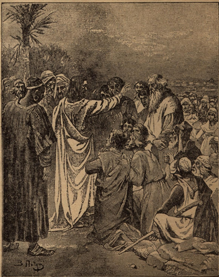
Иисусъ подготвя апостолитѣ за обществена работа.

Ходейки отъ градъ въ градъ и отъ село въ село да проповѣдва, Иисусъ забелязалъ, че народътъ е останалъ безъ учители и наставници, като стадо безъ овчарь. По-неже нѣмалъ възможность самъ да посети всички околни страни, Той казалъ на ученицитѣ Си: