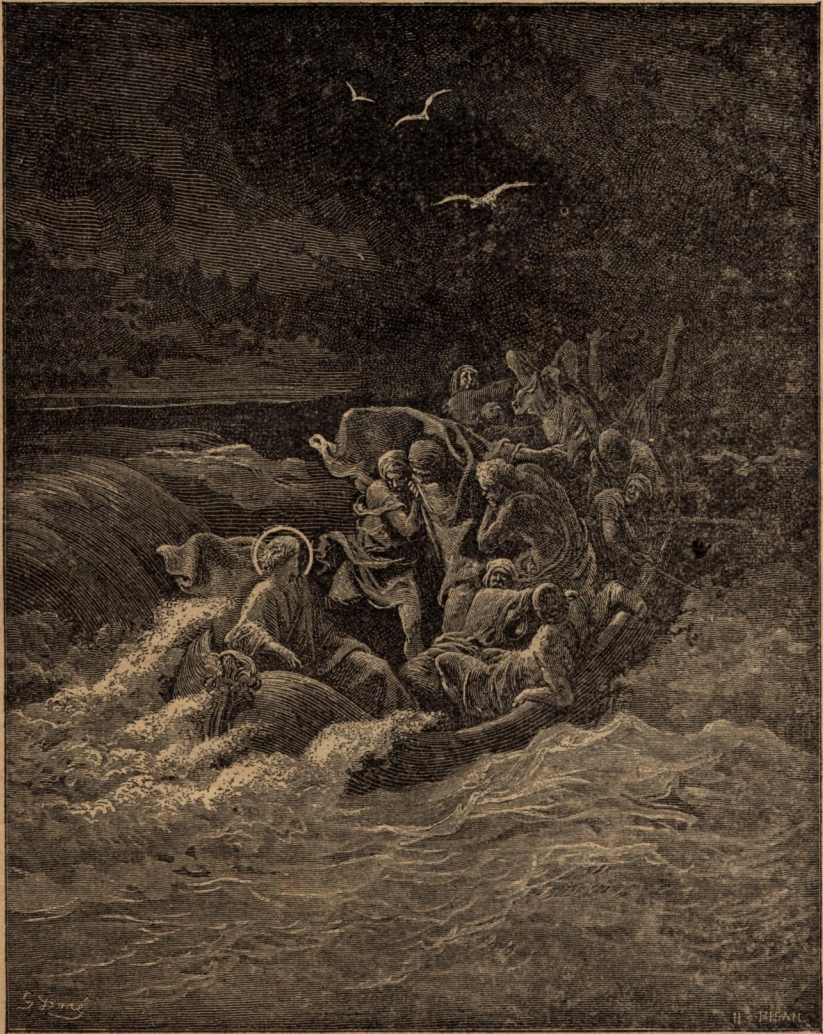
Христосъ укротява бурята.

— Маловърци, отъ що се боите? Где е вѣрата ви? И, като протегналъ ржка надъ разпѣненитѣ вълни, запретилъ на вѣтъра да духа, а на морето повелително казалъ: „Млъкни, престани!“