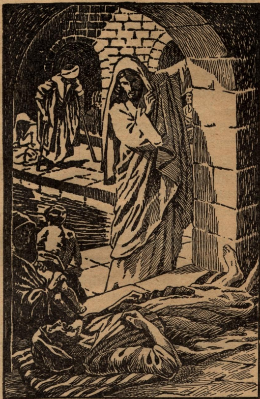
Иисусъ изцѣрѣва болния въ Витезда.

Не следъ много Иисусъ срещналъ изцѣрениа въ храма и му казалъ: „Сега си здравъ, гледай да не грѣшишъ вече, за да те не сполети нѣщо по-лошо.“ Той отишелъ и обадилъ на книжницитѣ и фарисеитѣ, че Иисусъ го е изцѣрилъ, и тѣ решили да убиятъ Иисуса, загдето нарушава сѣботната почивка.