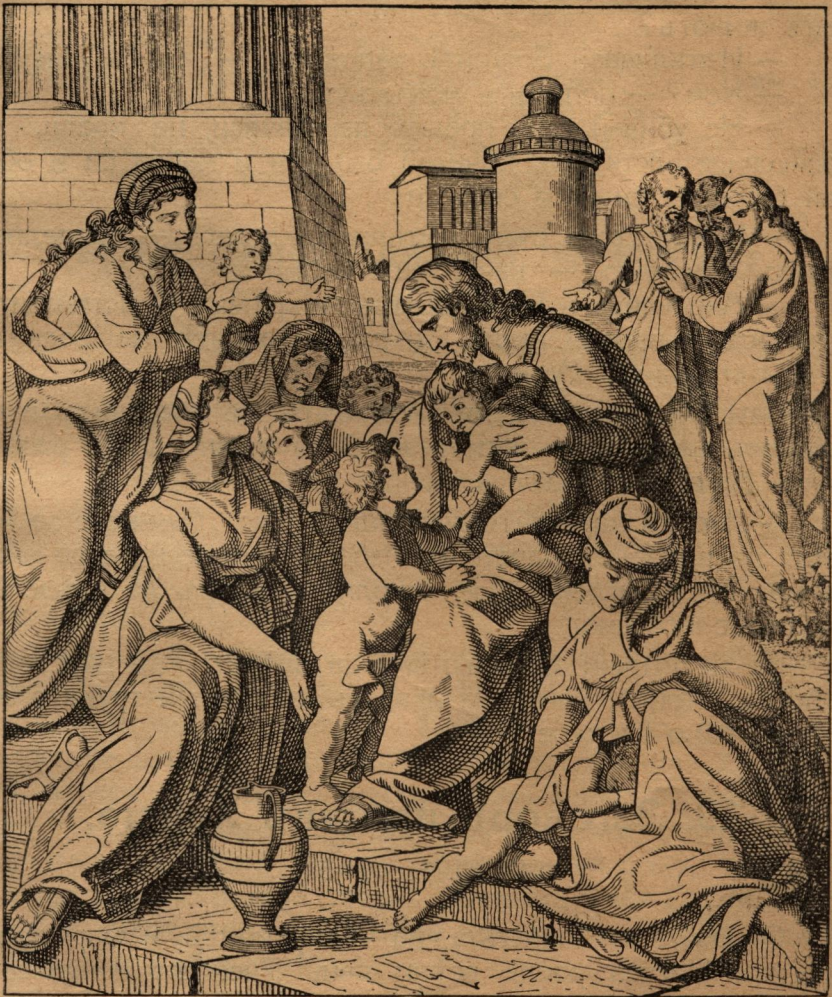
Иисусъ Христосъ благославя децата.

царството небесно. Който иска да бжде пръвъ, нека бжде слуга на всички. Докато не станете като това дете смирени, чисти и невинни, нѣма да влѣзете въ царството небесно. Който пъкъ съблазни едно отъ тия малкитѣ, които вѣр-