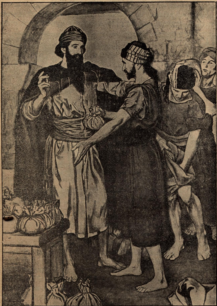
Притча за талантитѣ.

Богъ е далъ на човѣка различни дарби: умъ, сила мѣдрость и т. н. У едни тѣ сж по-голѣми, у други —