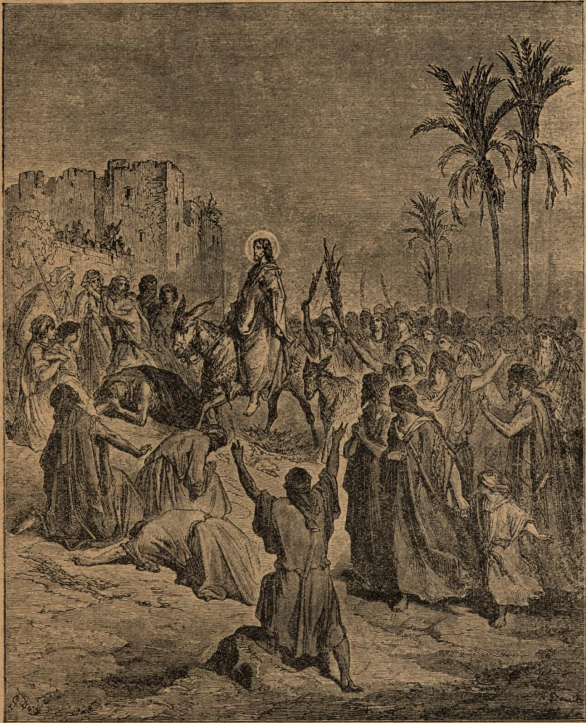
Тържествено влизане на Иисуса въ Иерусалимъ.

Когато стигналъ до града, Иисусъ извикалъ съ плачевенъ гласъ: „Иерусалиме, Иерусалиме, ще настане день,