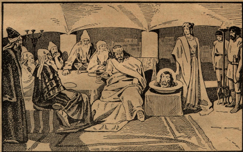
Смъртта на Иоана Кръстителя.

Дошелъ рождениятъ день на Ирода. За тоя празникъ той поканилъ много знатни и богати люде на гости. Въ време на гощавката Саломия , дъщеря на Иродиада, танцувала предъ гоститѣ. Всички били възхитени отъ хубавата игра. Самъ Иродъ се обърналъ къмъ момата и казалъ: