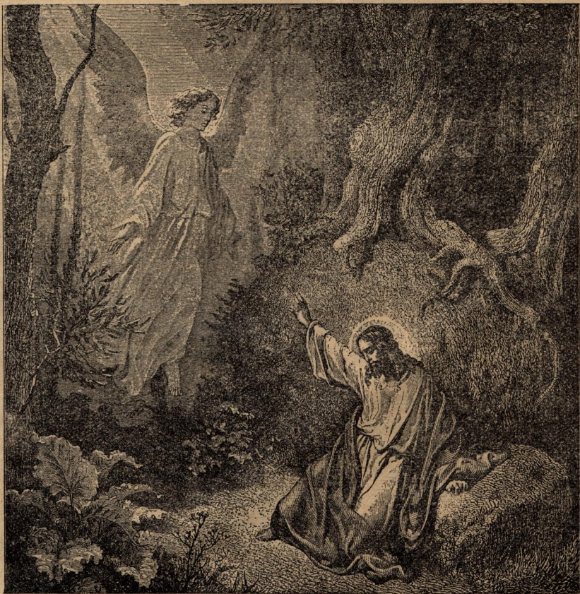
Въ Гетсиманската градина.

Въ Гетсиманската градина. Подиръ тоя разговоръ Иисусъ преминалъ заедно съ ученицитѣ Си Кедронския