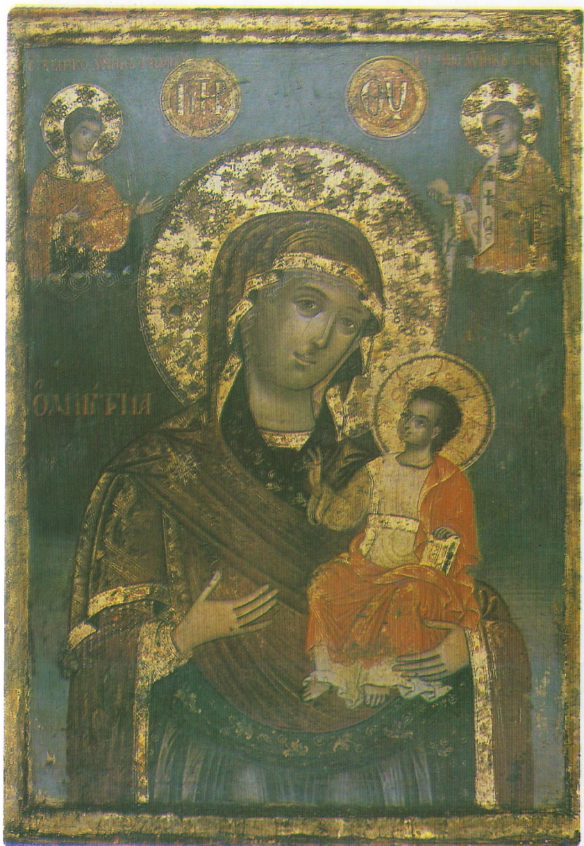
Фиг. 1 Икона на Богородица с младенеца