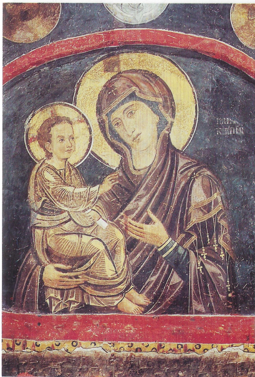
Фиг. 3 Умиление Богородично