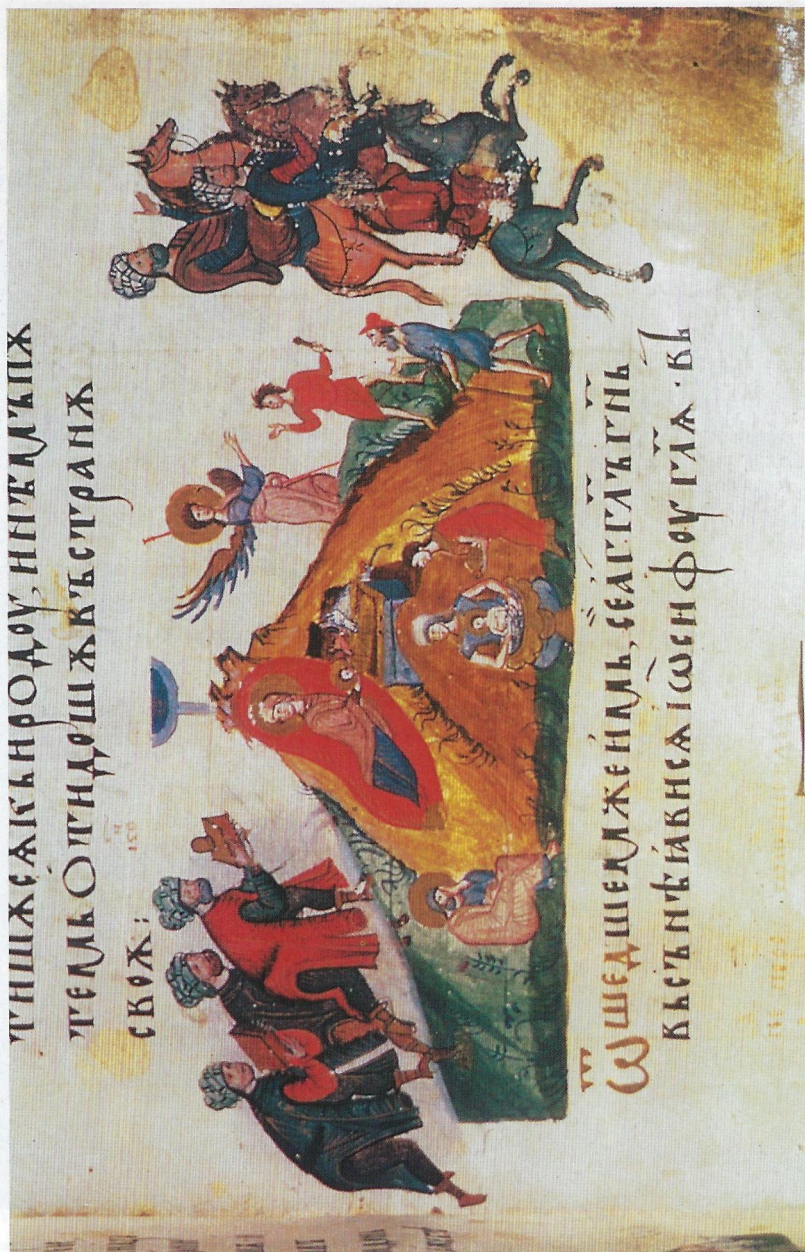
Фиг. 2 Посещението на Влъхвите (публикацията е с разрешението на Британската библиотека).