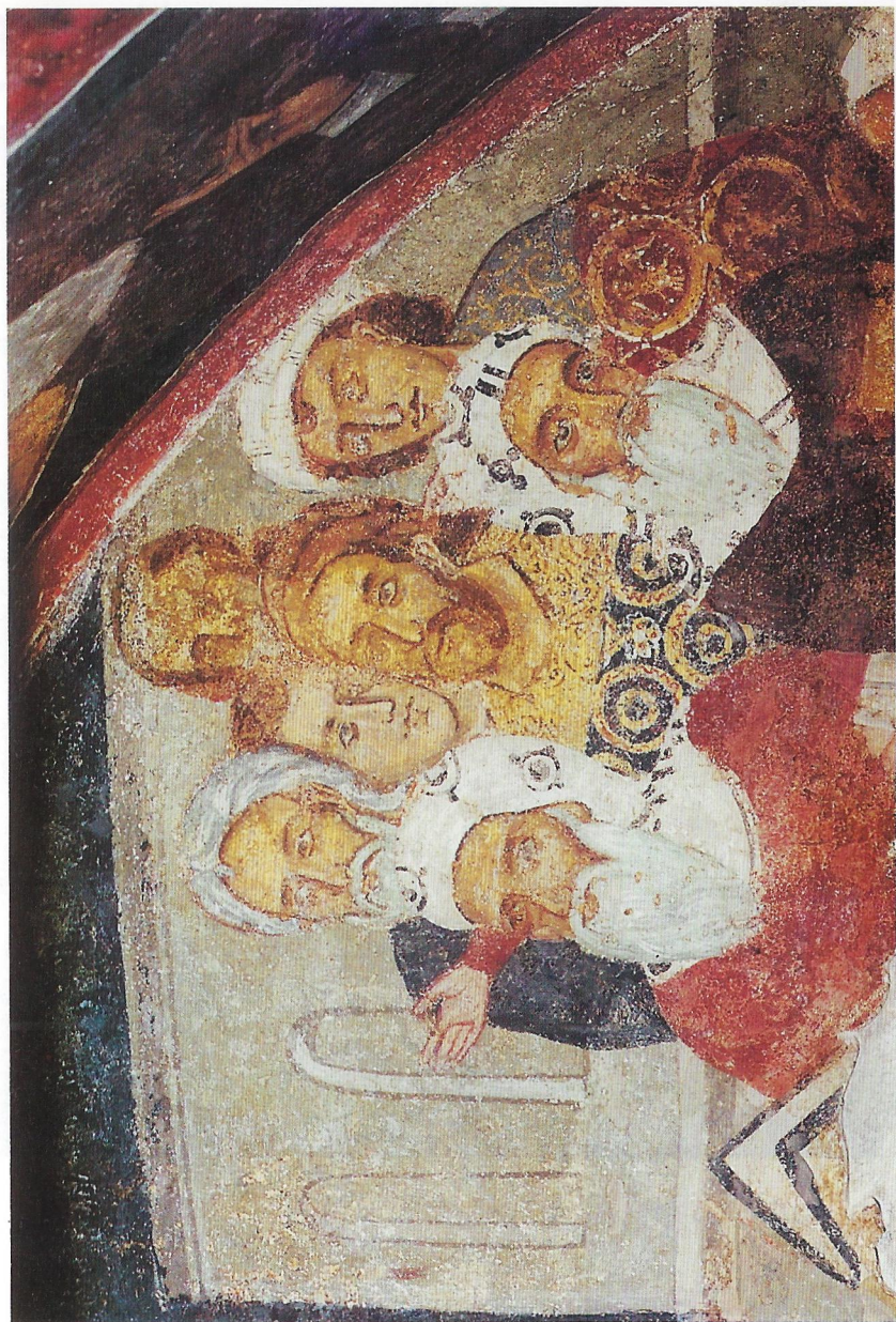
Фиг. 7 Левите разговарят с Христос