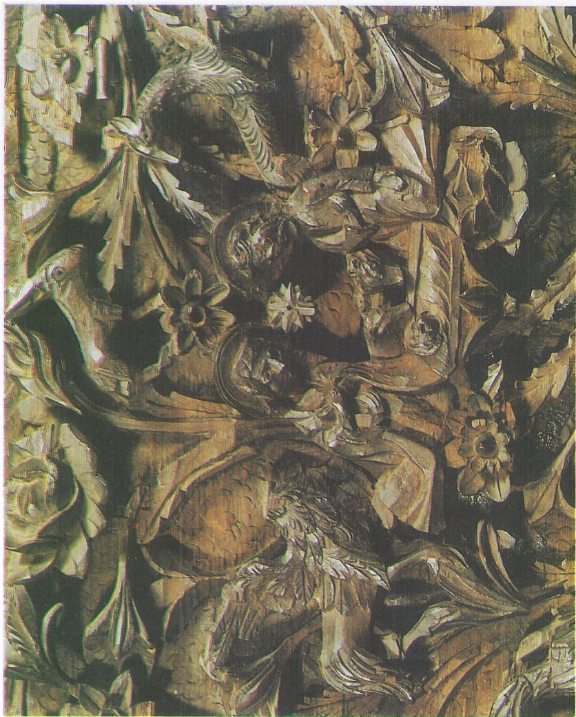
Фиг. 9 Рождество Христово - дърворезбена сцена от църквата "Света Богородица" в Пазарджик