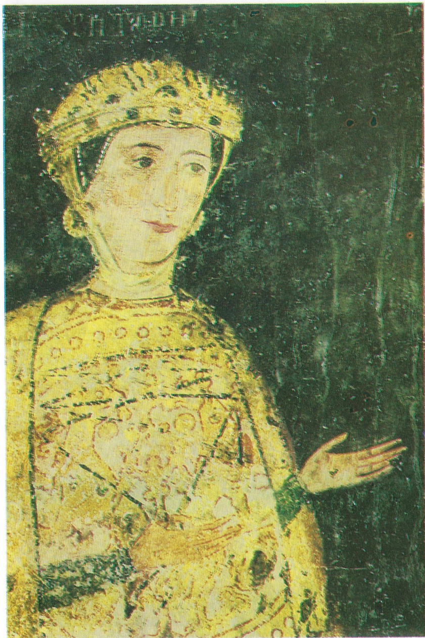
Фиг. 2 Посещението на вълхвите (публикацията) Фиг. 4 Десислава - фреска от Боянската църква