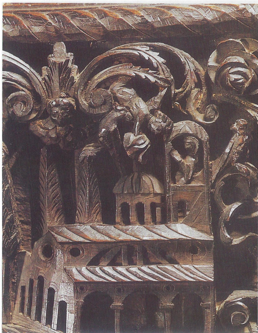
Фиг. 11 Благовещение - детайл от дърворезбената сцена "Въведение Богородично"