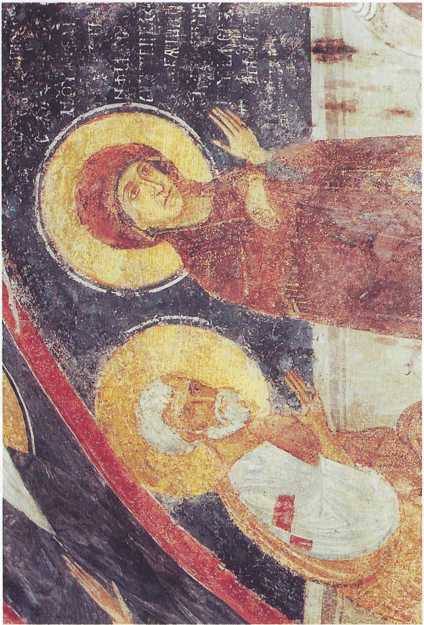
Фиг. 6 Мария и Йосиф в храма