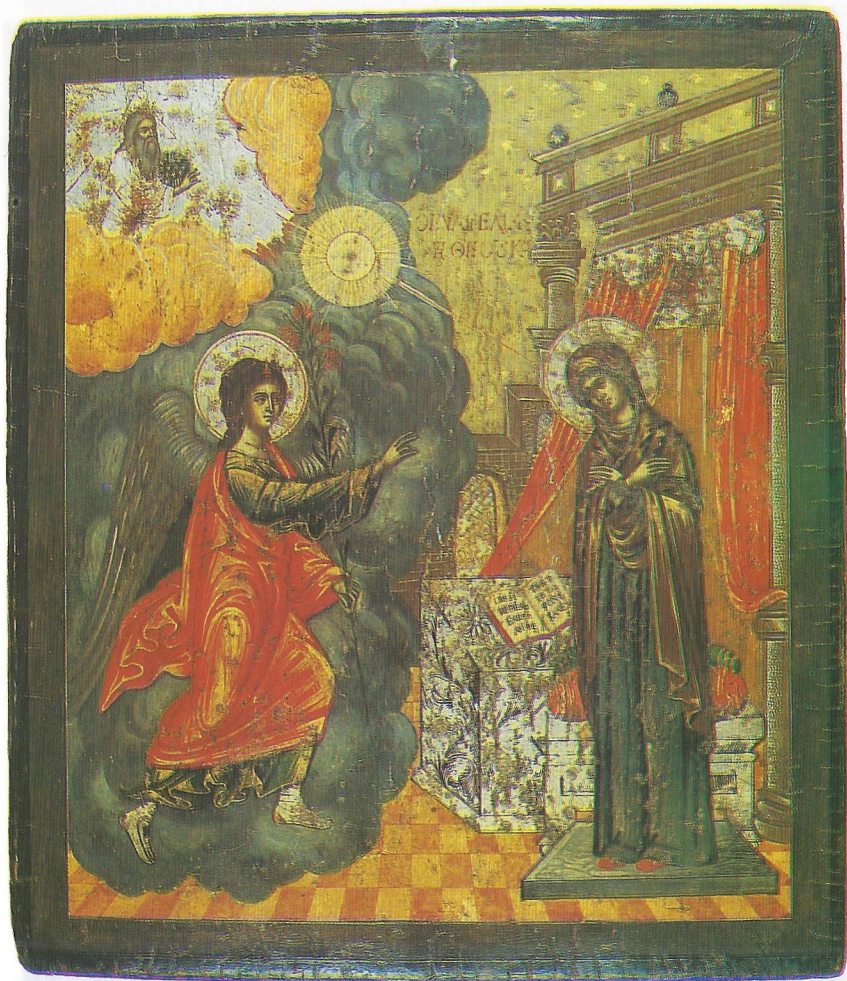
Фиг. 16 Икона на Благовещение Христово