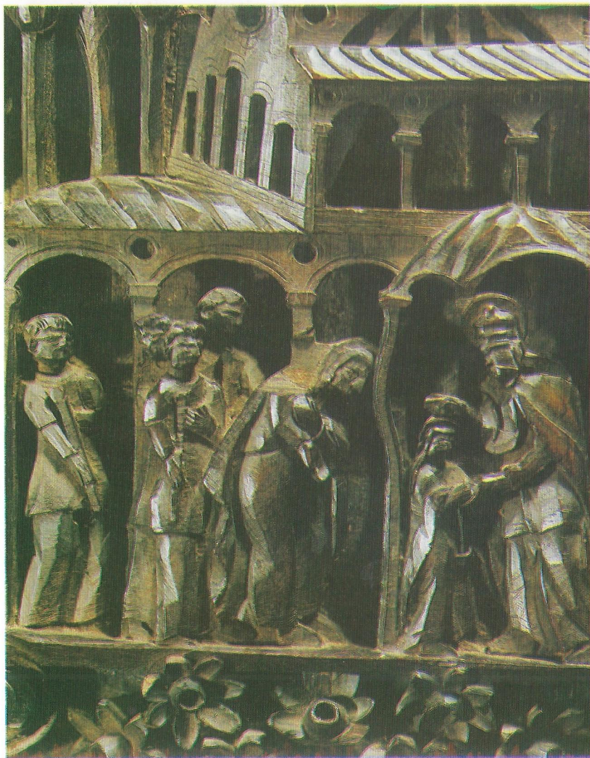
Фиг. 13 Детайл от "Въведение Богородично" в пазарджишката църква "Света Богородица"