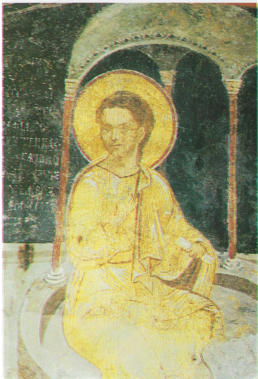
Фиг. 5 Дванадесетгодишният Христос