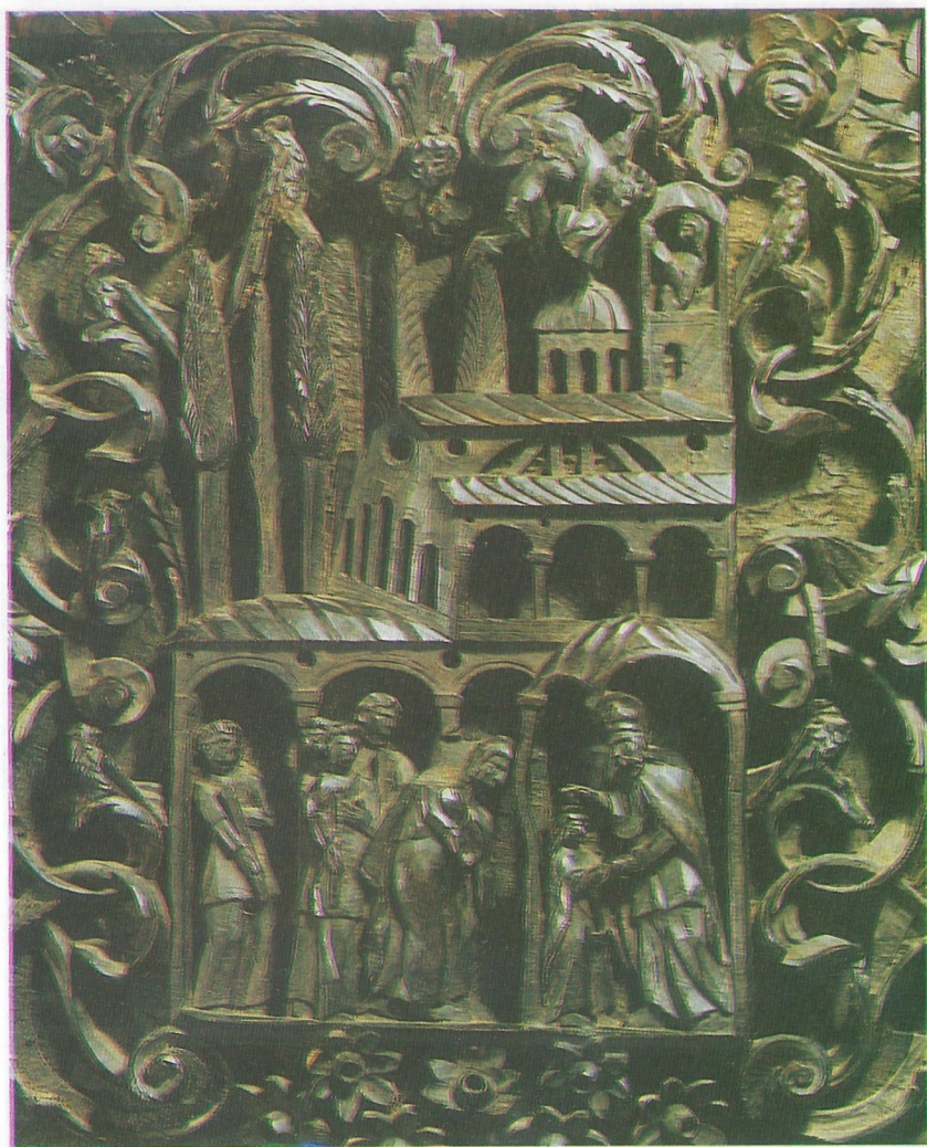
Фиг. 12 Въведение Богородично - дърворезба от църквата "Света Богородица"