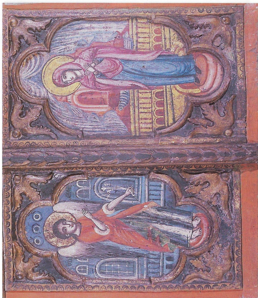
Фиг. 14 Царските двери на български възрожденски иконостас