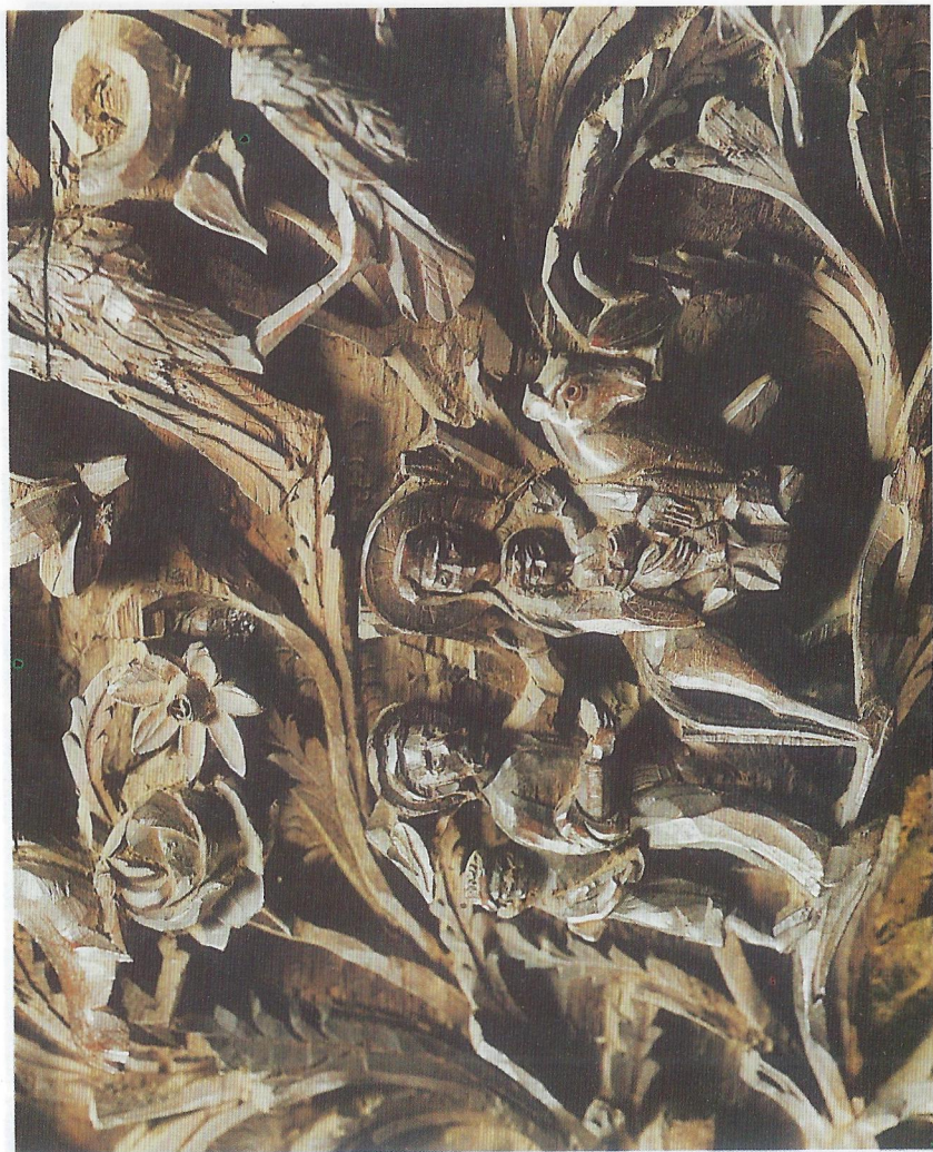
Фиг. 10 Бягството в Египет - дърворезба от църквата "Света Богородица" в Пазарджик