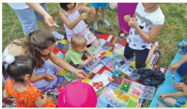
Изработване на гривнички и колиета.