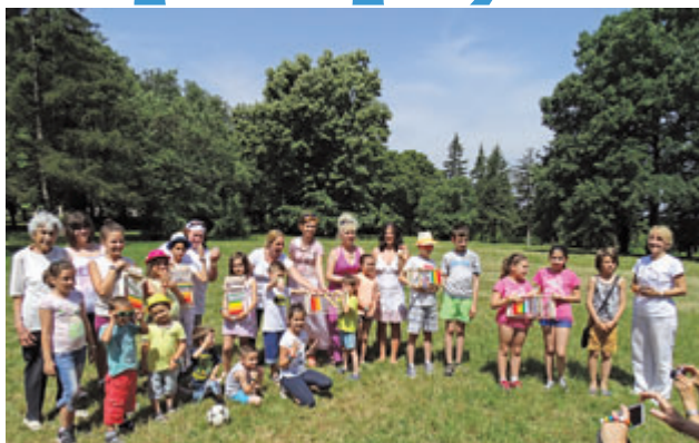
Обща снимка на всички деца от форума.

като „Българската Виена“. Затова първата атракция в програмата на форума, наречен от домакините „детски събор“, бе пътешествие по река Дунав. Цялото множество от деца и възрастни се качи на корабът „Русчук“. Повечето от тях за първи път се качиха на кораб и цялото им