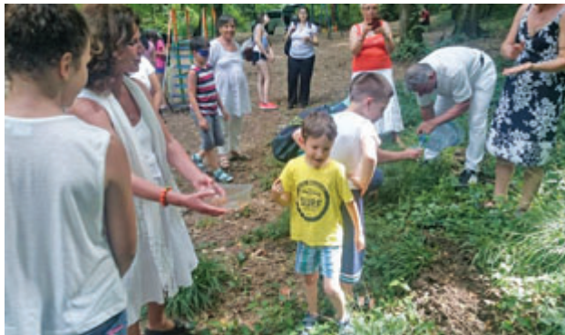
Посяване на семена и костилки от плодовете.

няколко мига да премигат с очи и вече си говорят и играят заедно.