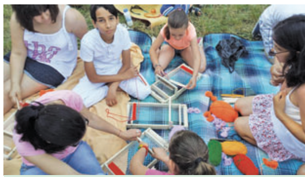
Тъкане на станчета.