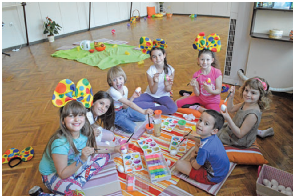
Децата заедно играеха Паневритмия, заедно боядисаха яйца за Великден, заедно рисуваха, заедно живееха.

Харесвам Паневритмията, защото тук се учим как да си помагаме, когато някой има нужда и как да се грижим за много неща.