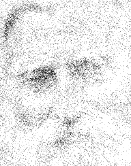
УЧИТЕЛЯ Петър Константинов Дънов (Беинса Дуно) 1864-1944