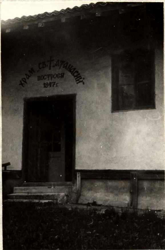
Църквата „Св. Атанасий“