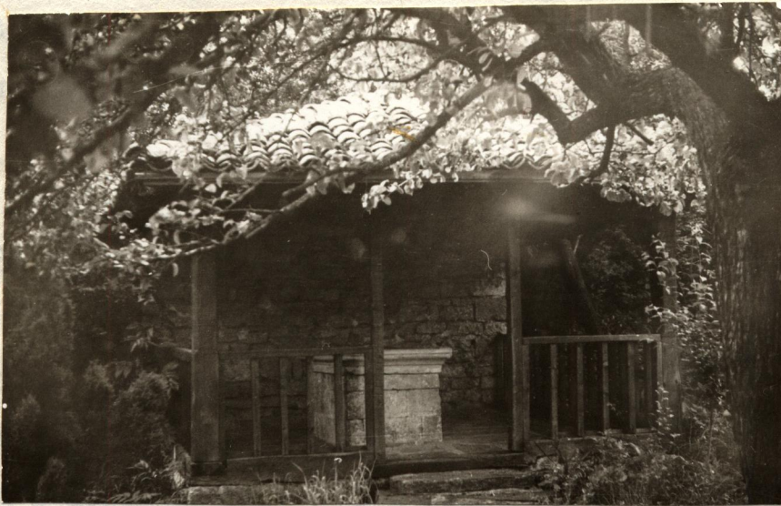
Гробът на Атанас Златев