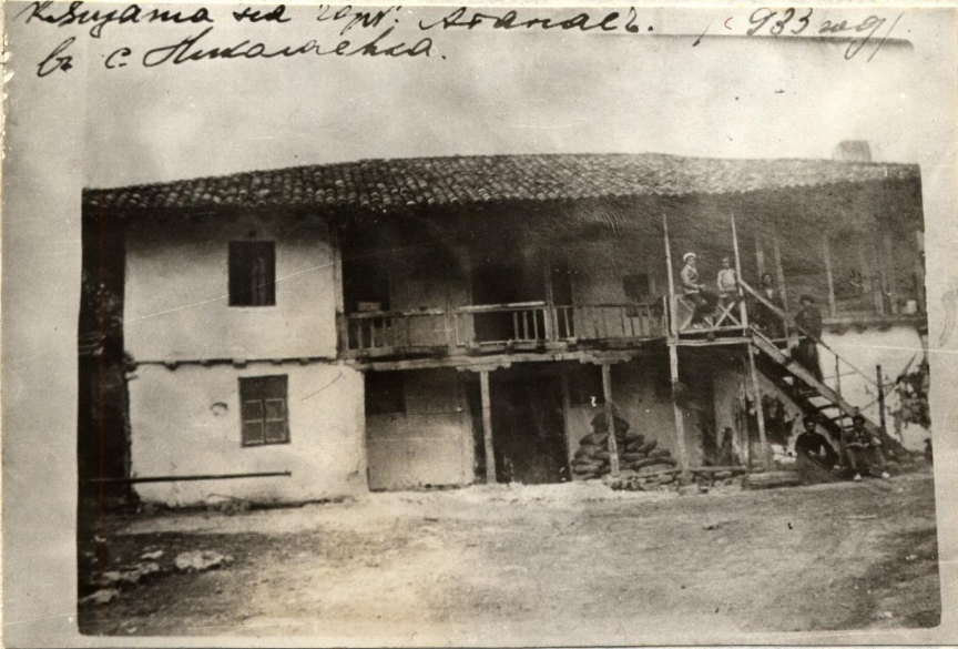
Къщата на Атанас Георгиев

Къщата на г-н. Атанасъ. / 1933 г. / в с. Панагюрица.