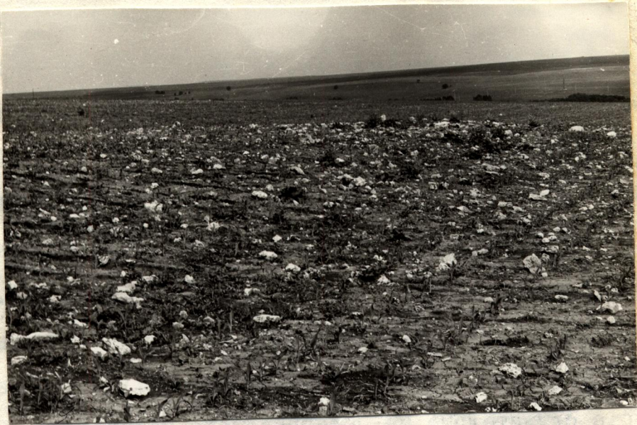
Развалините в местността „Юрта“